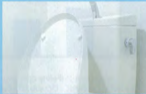
洗浄レバー等にもお使い下さい