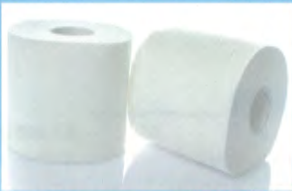
トイレットペーパーが破れない